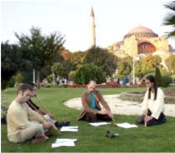
Musikuppförandet framför Hagia Sofia i Istanbul.