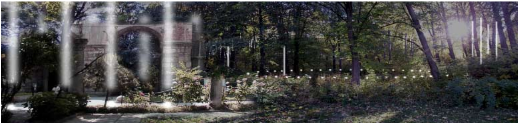
Hagia Sofia i Vårbygård. (Skiss nr 21) bäckravinen dubbel exponering

Hagia Sofia gruppens arbete har bland annat uppmärksammats i flera tidningsartiklar bl.a Svenska Dagbladet den 18 juni 2003.