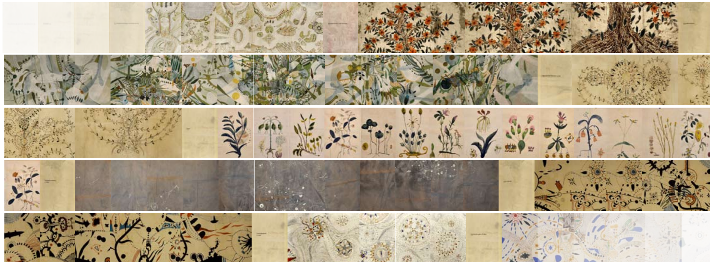
Exempel på flödet av sidor i den tänkta boken