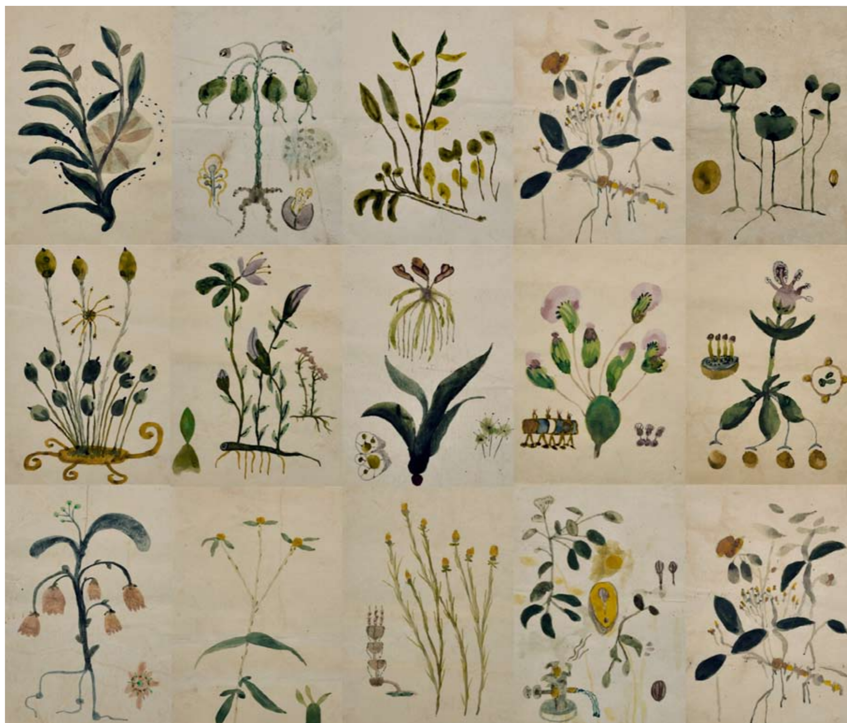
Växter (vattenfärg mixedmedia limmade A3 papper) 15 sidor 126x180 cm