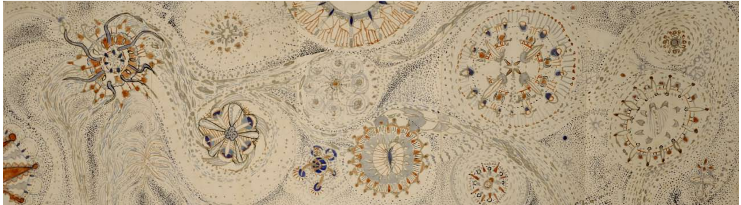
Planeter(vattenfärg mixedmedia limmade A3 papper) 5 sidor 42x150 cm