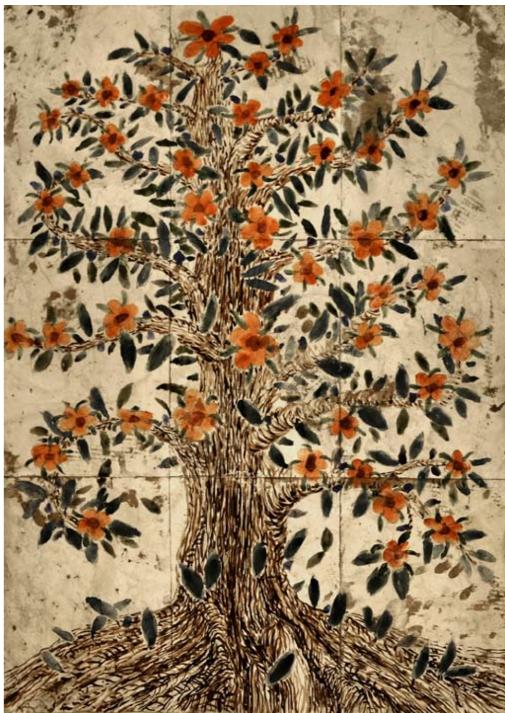
Blommande träd (röda blommor) (vattenfärg mixedmedia limmade A3 papper) 9 sidor 126x90 cm