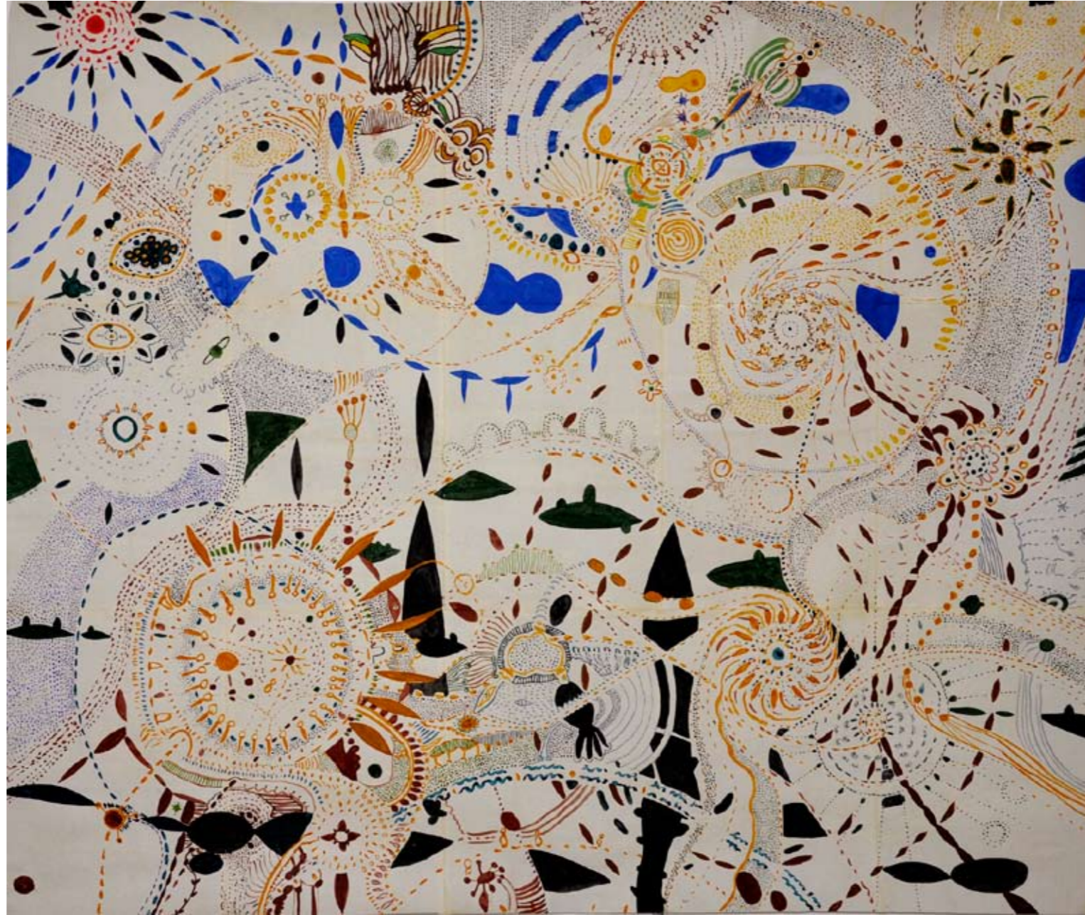
Vi kom till ett annat namn (vattenfärg mixedmedia limmade A3 papper) 15 sidor 126x150 cm