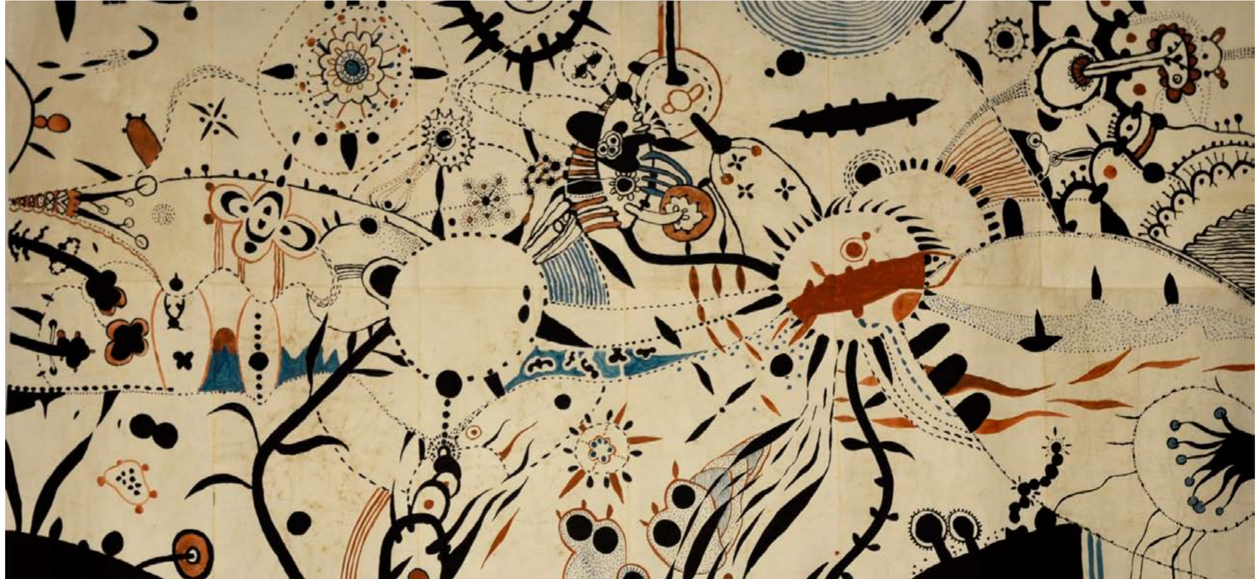
oob var är du? (vattenfärg mixedmedia limmade A3 papper) 12 sidor 84x180 cm