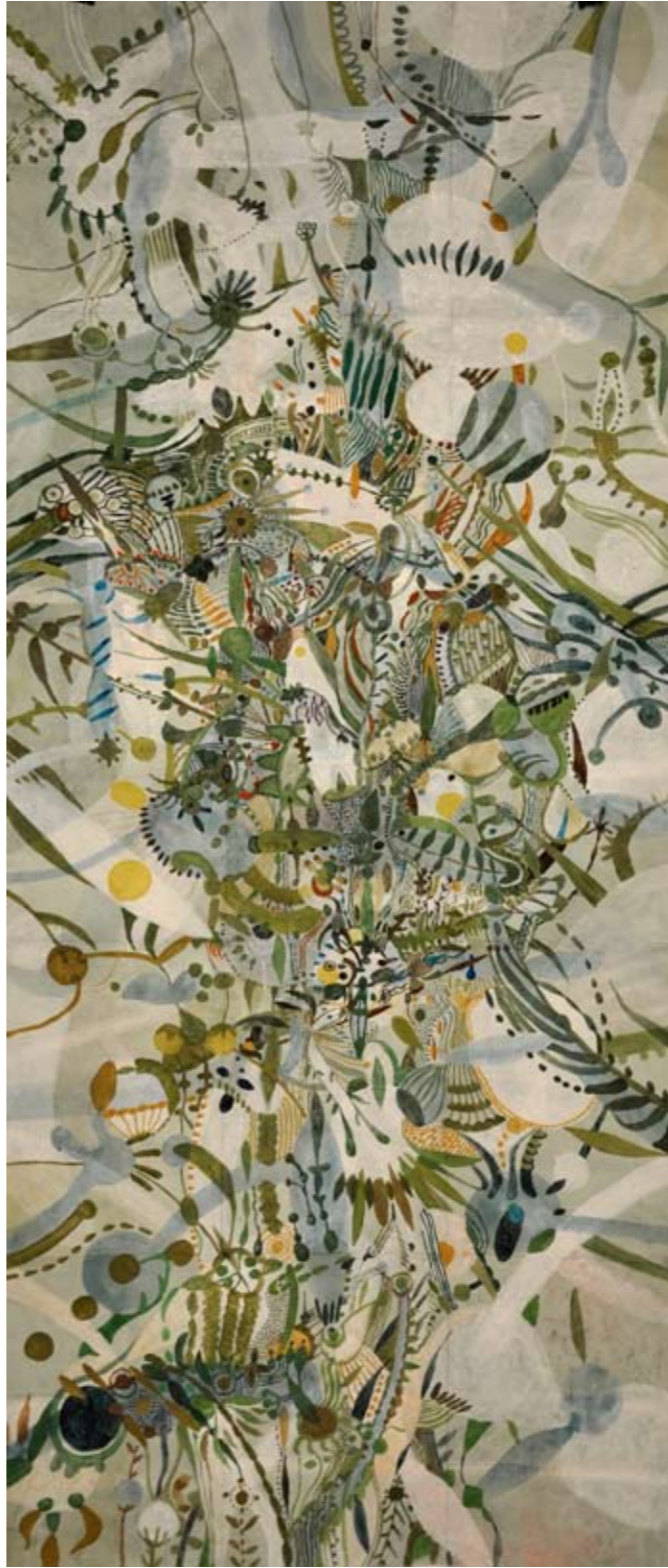
Det andra rummet (vattenfärg mixedmedia limmade A3 papper) 15 sidor 210x90 cm