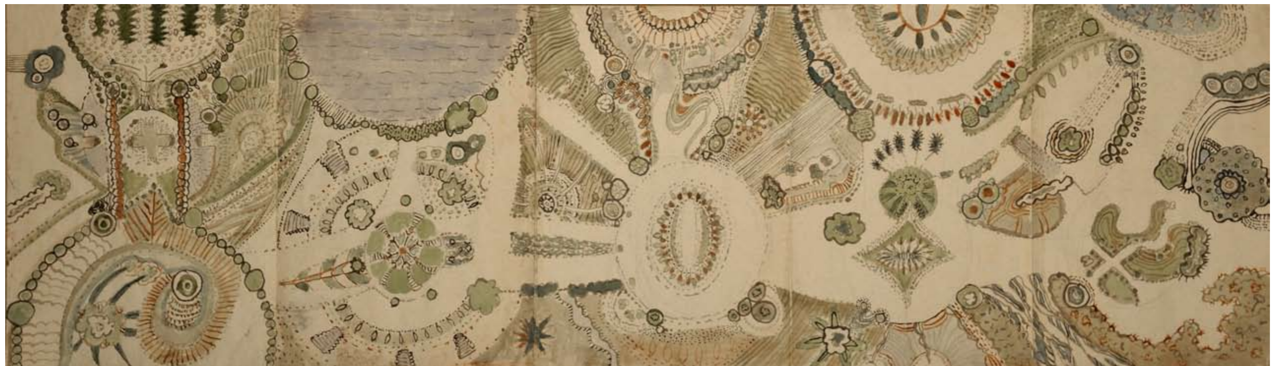
En trädgård med gångar som förgrenar sig. (vattenfärg mixedmedia limmade A3 papper) 5 sidor 42x145 cm