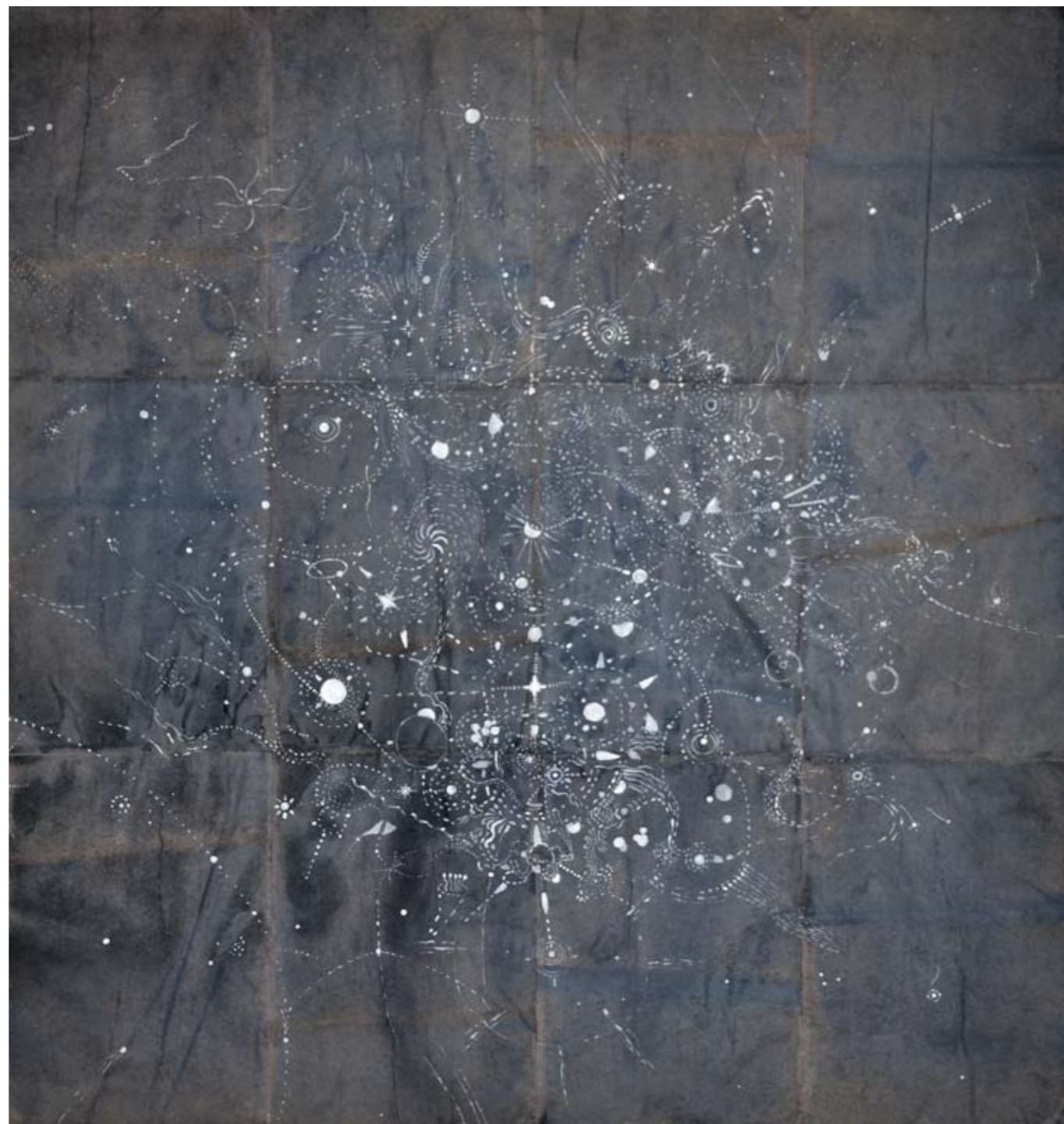
Topografi i månlyus (vattenfärg mixedmedia limmade A3 papper) 12 sidor 126x150 cm