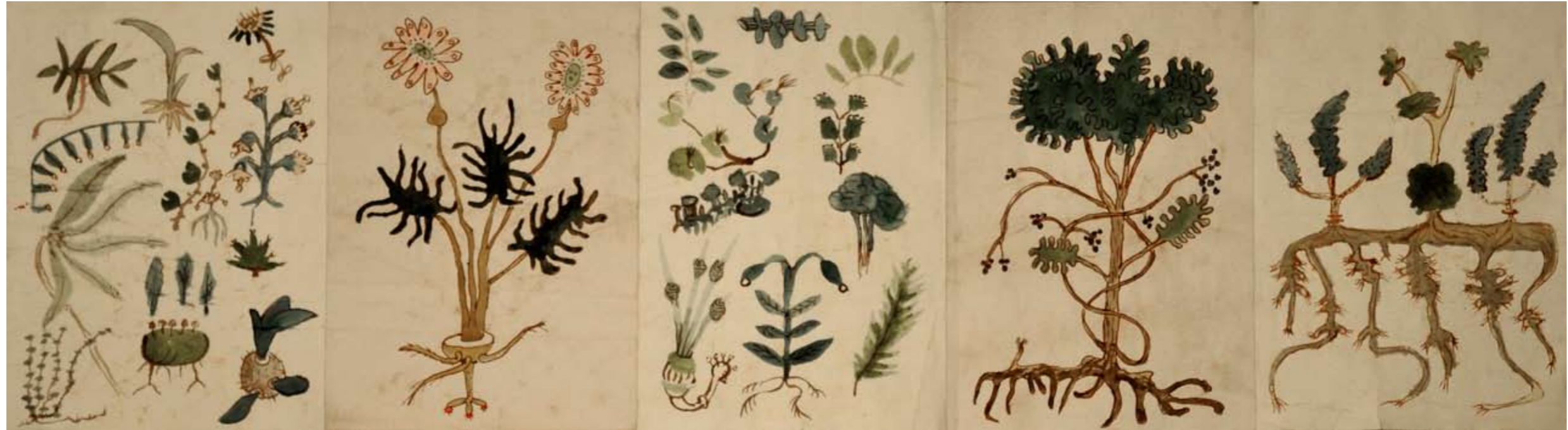
Plantor och träd(vattenfärg mixedmedia limmade A3 papper) 5 sidor 42x150 cm