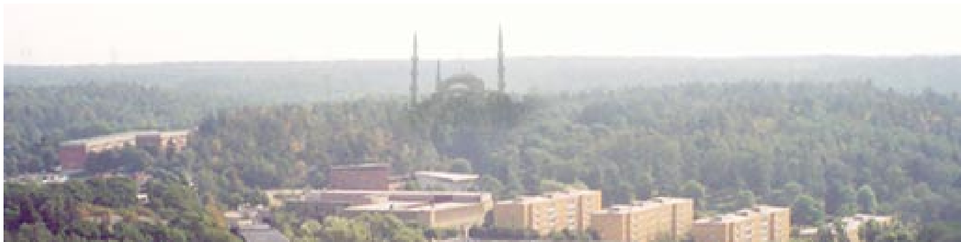
Hagia Sofia i Vårby gård