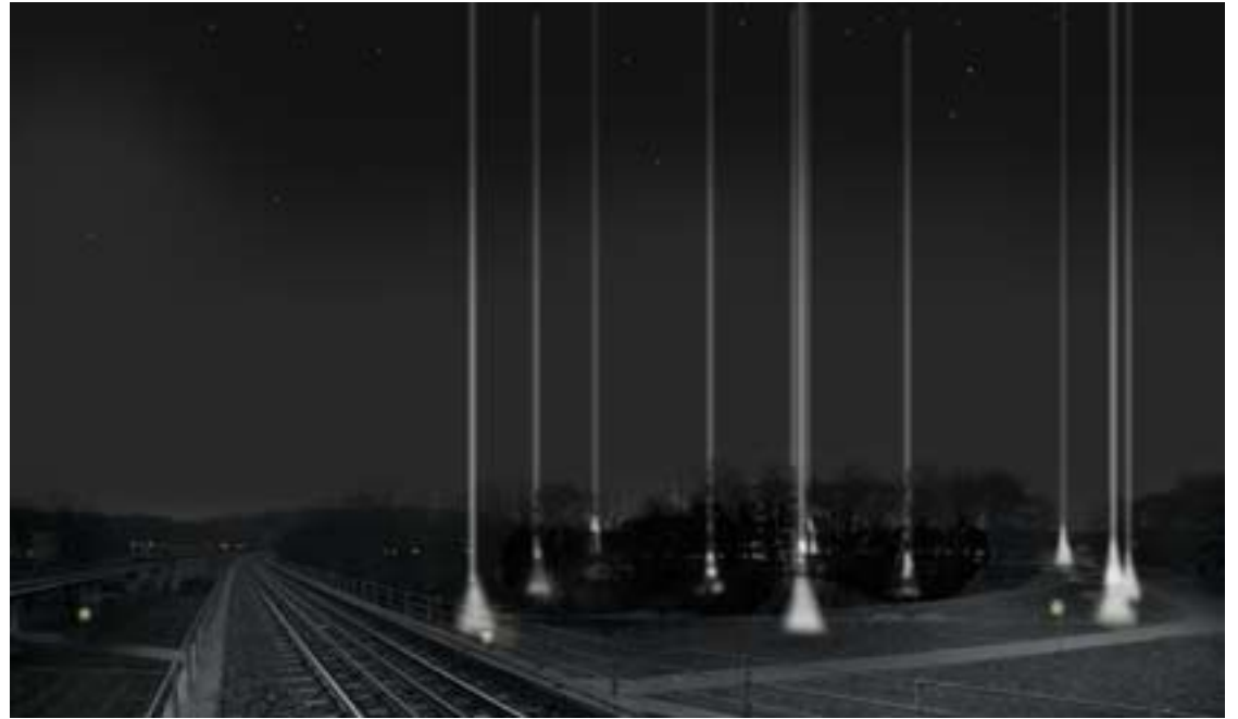
Ljussättning av osynlig byggnad