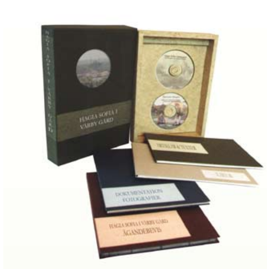
Förslag till Ägarebesvis och Folder