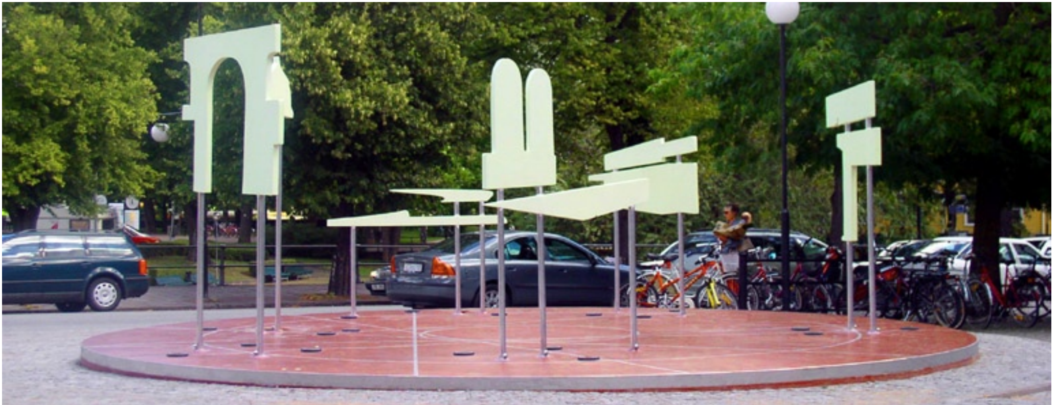
Skulpturen sedd mot Svartån