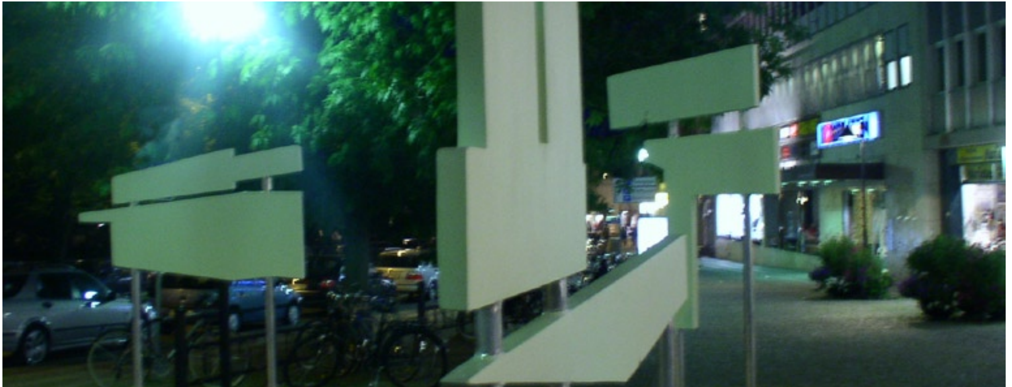
Nattbild med efterlysande färg