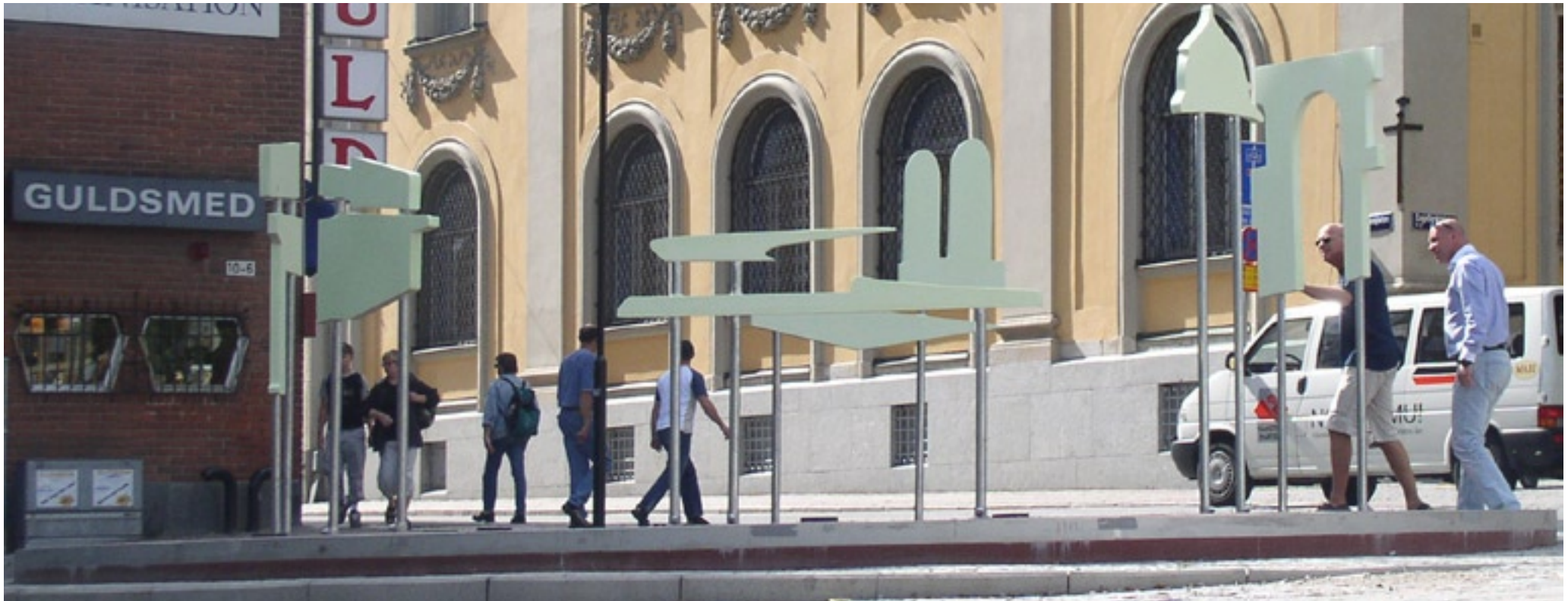
Skulptur och flanörer